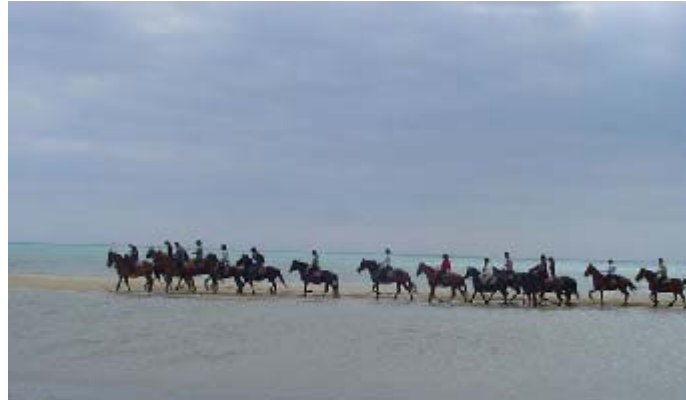
Sentiers Cathares Quéribus - Montségur et Quéribus - Carcassonne La Mer