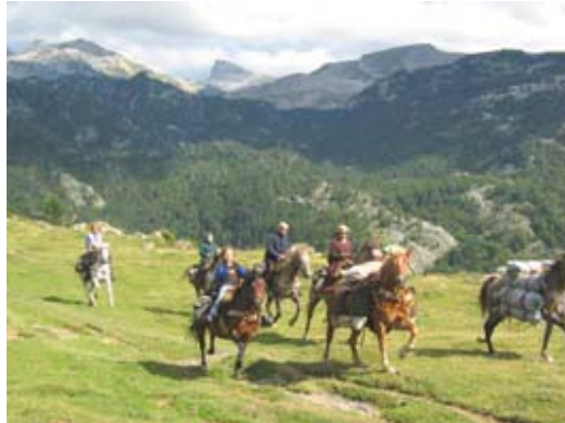
Haute Traversée des Pyrénées Convoyage de Chevaux libres

Amoureux du milieu naturel, Claire ou Yves vous emmènerons avec leurs demi-sangs arabes à la découverte du monde magique de la montagne, du parfum des garrigues à la fraîcheur des névés.