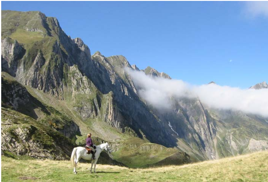
Frontière Franco-espagnole, Port d'Aula, juste en dessous du mont Vallier