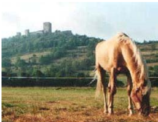
De l'Ariège aux Corbières Les Châteaux Cathares

Situé à coté de Lavelanet, à la limite entre l'Aude et l'Ariège, CAVALEA vous emmène à la découverte des richesses pyrénéennes. Les châteaux cathares, la méditerranée, la montagne sauvage, autant de destinations au service de vos rêves. Votre voyage, c'est notre métier et notre passion, alors.....Qu'attendez-vous?