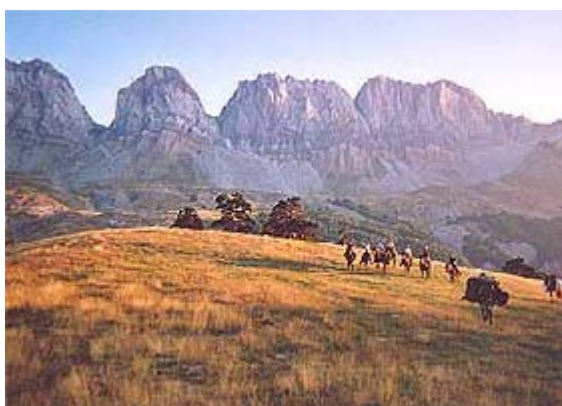
Sierra de Guara Randonnée en vallée d'Ossau

Chevauchée Pyrénéenne c'est "La Magie du Voyage" à cheval de la Vallée d'Ossau, piémont du haut Béarn, à la sierra de Guara en Aragon, ou sur des itinéraires d'altitude entre le Pays Basque et la Catalogne. Vous découvrirez la grande randonnée pleine nature avec mules de bât, la convivialité des bivouacs et des gîtes montagnards.