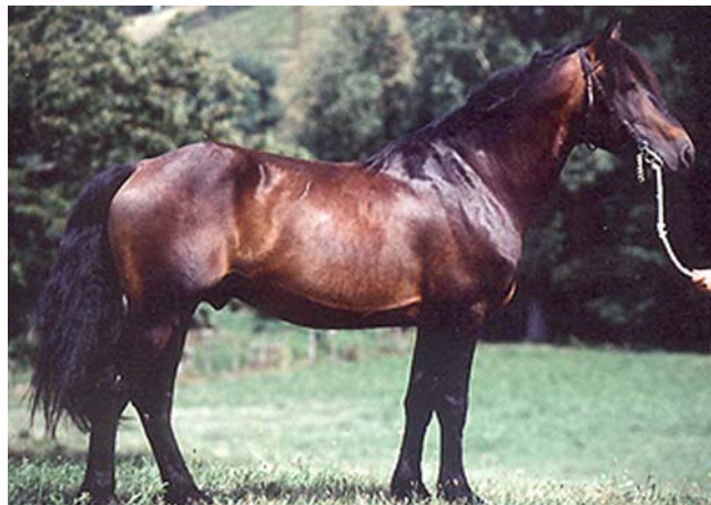
Silex, Étalon Castillonnais