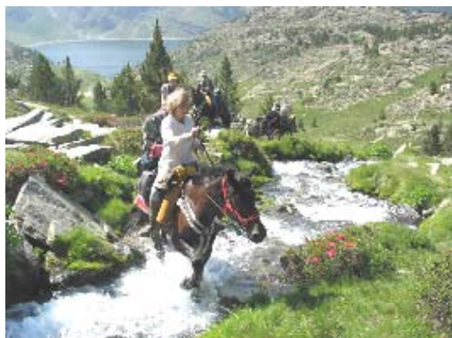
Randonnée des Lacs Randonnée Passe Montagne

Nous avons dit Esprit du Cheval ... Parce que nous respectons nos chevaux en leur offrant un mode de vie naturel en troupeau dans de grands espaces. Aventure ... Parce que nous avons un goût prononcé pour la liberté, parce que nous sommes en quête perpétuelle de nouveaux itinéraires toujours plus sauvages. Pyrénées, parce que cette terre d'aventure a su préserver une nature vierge et une authenticité absolue.