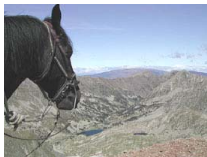
Transhumance des Princes Noirs A cheval sur les 3 frontières